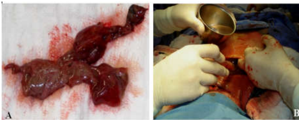
Figura 5. A: Tecido subcutâneo e fâscia necrótica removidos. B: Exploração da ferida cirúrgica e irrigação (lavagem) abundante com SF 0,9%