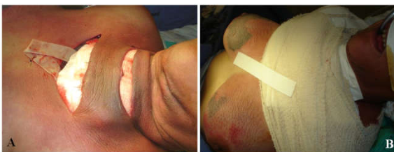
Figura 6. A. Curativo com carvão ativado com prata e inserção de drenos de Penrose. Notar que os retalhos cutâneos não foram aproximados B: Curativo compressivo